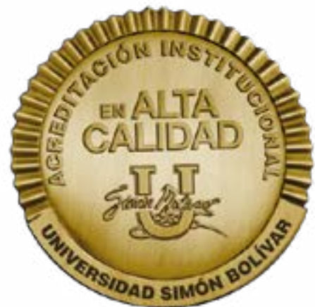
Res. 015867 - Mineducación