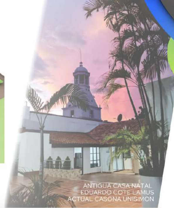
ANTIGUA CASA NATAL EDUARDO COTE LAMUS ACTUAL CASONA UNISIMÓN